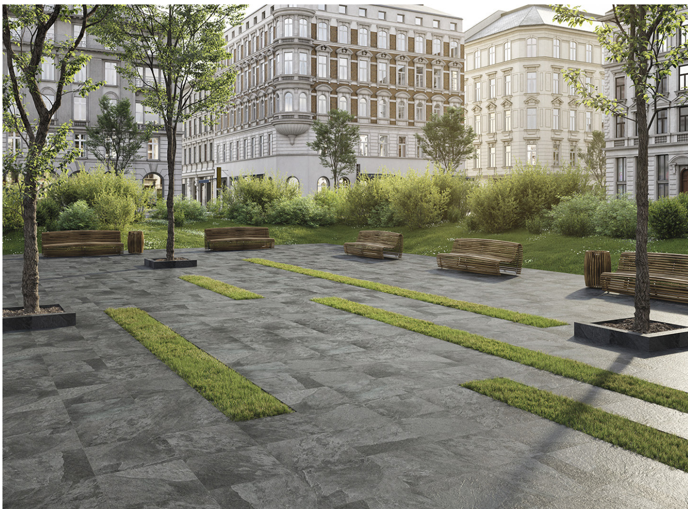
Figura 1. Producto instalado

La comparación de productos de la construcción se debe hacer sobre la misma función, aplicando la misma unidad funcional y a nivel del edificio (u obra arquitectónica o de ingeniería), es decir, incluyendo el comportamiento del producto a lo largo de todo su ciclo de vida, así como las especificaciones del apartado 6.7.2 de la Norma UNE-EN ISO 14025.