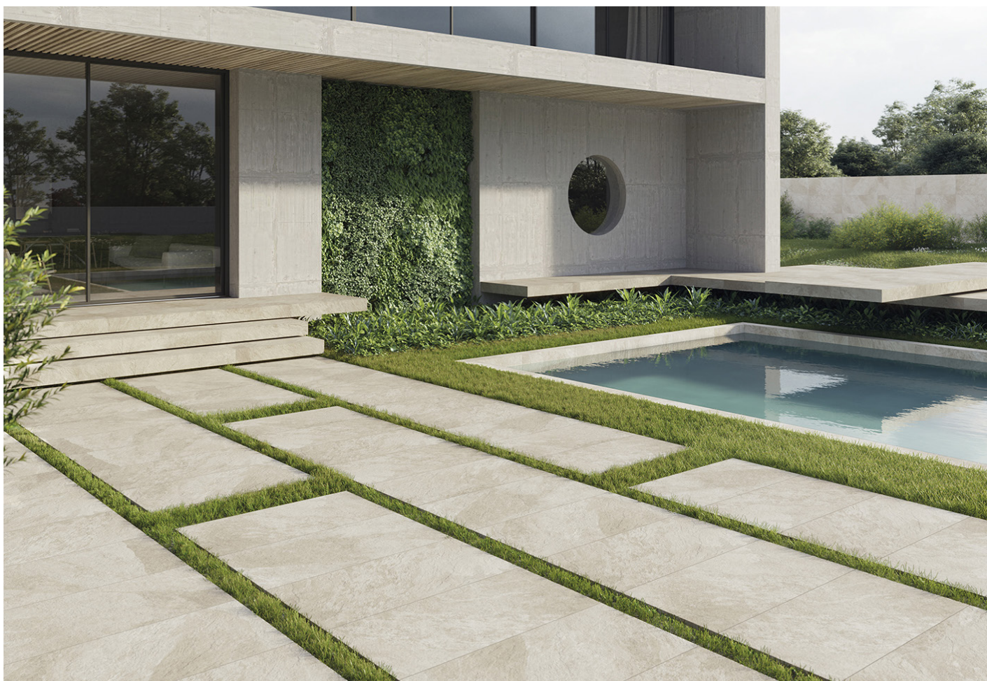
Figura 2. Producto instalado

No hay criterios universales para decir que un valor del coeficiente es “bajo” o “alto”, aunque en la práctica se suelen considerar bajos los valores inferiores al 30 o 40 %, moderados entre esas cantidades y aproximadamente el 80 % y cuando se superan el 120 o 140 % ya se considera que la dispersión es bastante elevada.